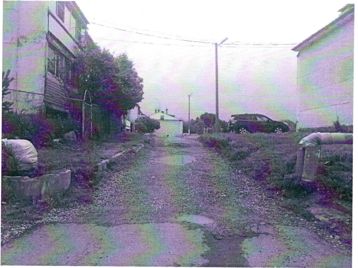
Фото 1. Подъезд к дворовой территории

Состояние дворовой территории в настоящее время (лето 2020 г.)