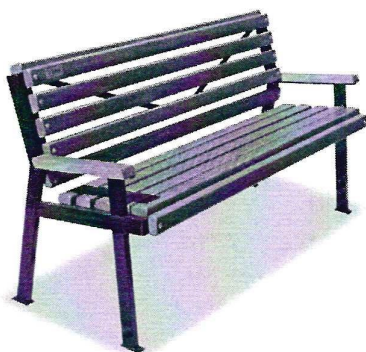
Скамейка уличная. Габаритные размеры 800*750*2000. Высота сиденья 470 мм. Ширина сиденья 400 мм.

Визуализированный перечень (минимальный) образцов элементов благоустройства, предлагаемых к размещению на дворовой территории